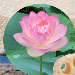
晩生品種 ひっちゅう 備中れんこん

鳴門市西部には見渡す限りのれんこん畑があるって知ってた? 市場で最も美味しいと評判の「備中れんこん」を掘りに行かなきゃソンソン♪