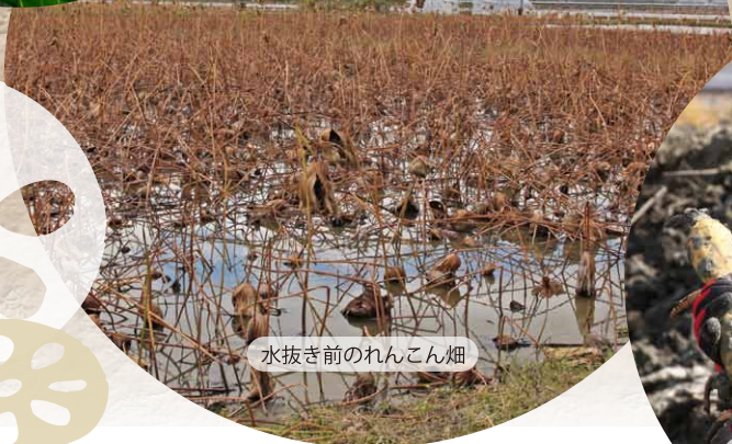
水抜き前のれんこん畑