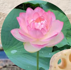
晩生品種 ひっちゅう 備中れんこん

鳴門市西部には見渡す限りのれんこん畑があるって知ってた? 市場で最も美味しいと評判の「備中れんこん」を掘りに行かなきゃソンソン!