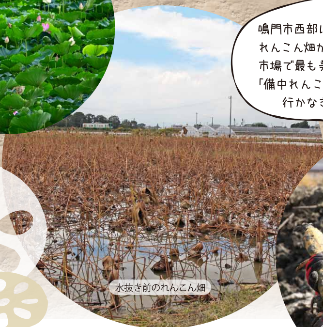
水抜き前のれんこん畑